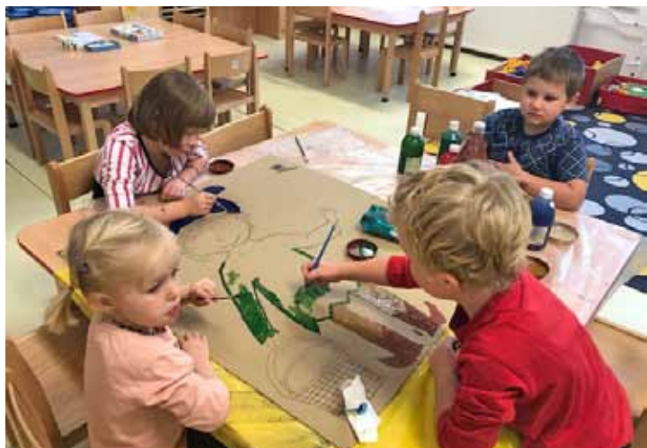
Výroba skřítky Vítka