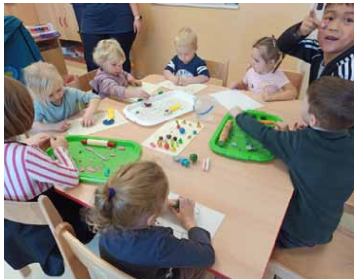
Modelování ovoce z plastelíny