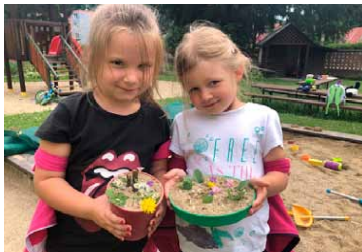
Zdobení „dortíků“ z písku